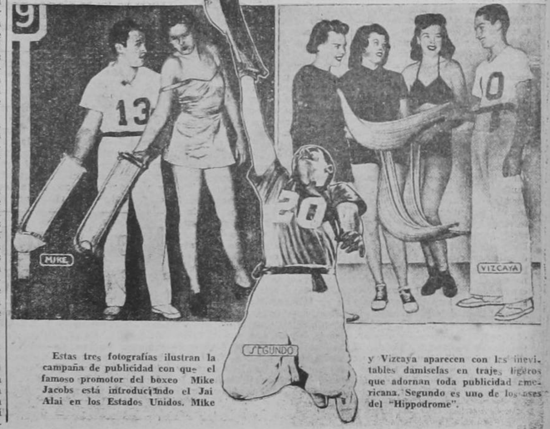
Estas tres fotografías ilustran la campaña de publicidad con que el famoso promotor del boxeo Mike Jacobs está introduciendo el Jai Alai en los Estados Unidos. Mike

Para su experimento de pelota vasca, Mike Jacobs ha importado medio centenar de los mejores jugadores obtenibles,